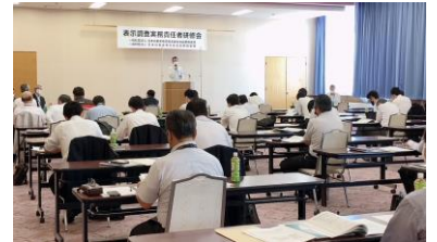
10/7(木) 東北信会場 JAグリーンホールミナミ