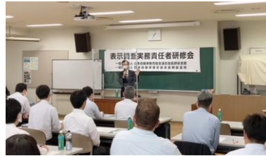
10/6(水) 中南信会場 長野県総合教育センター

引き続き、広告等における適正表示の推進と共に、表示管理体制の整備・強化を図る為、研修会を実施して参ります。