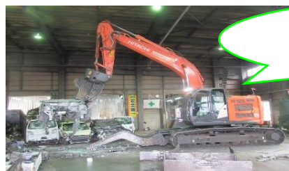
見学一番人気の解体機(ニブラ) 破壊力バツグンです!