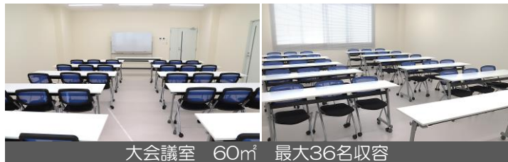
大会議室 60㎡ 最大36名収容