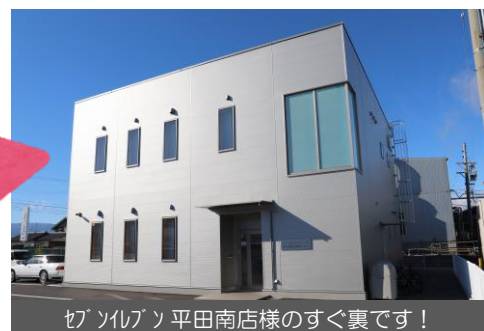
セブソノブソ 平田南店様のすぐ裏です！