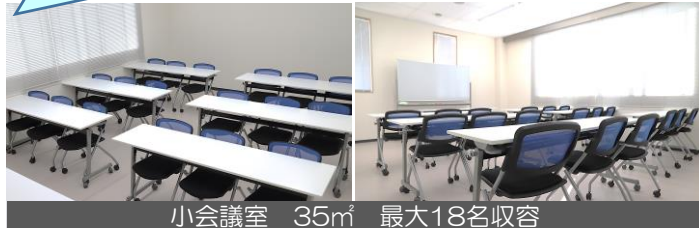
小会議室 35㎡ 最大18名収容

机の配置は、スクール形式・シアター形式、口の字型、コの字型など自由に変更ができます。